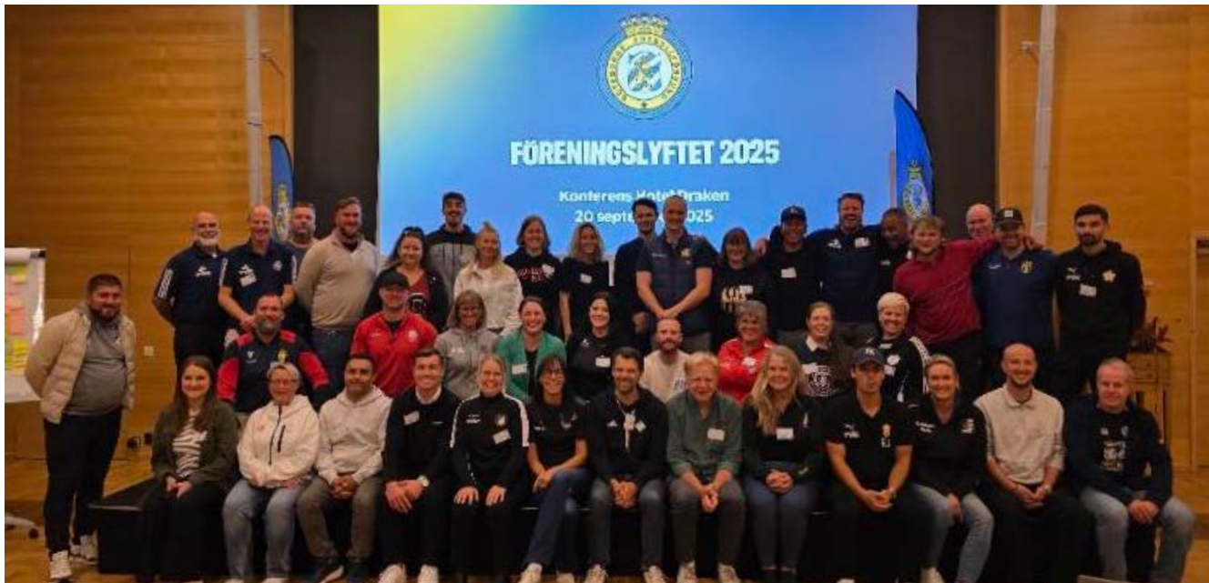
Lagfoto Föreningslyftet 2025