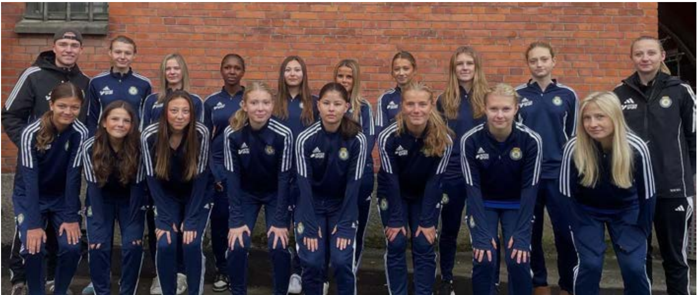
Distriktslag flickor 2009