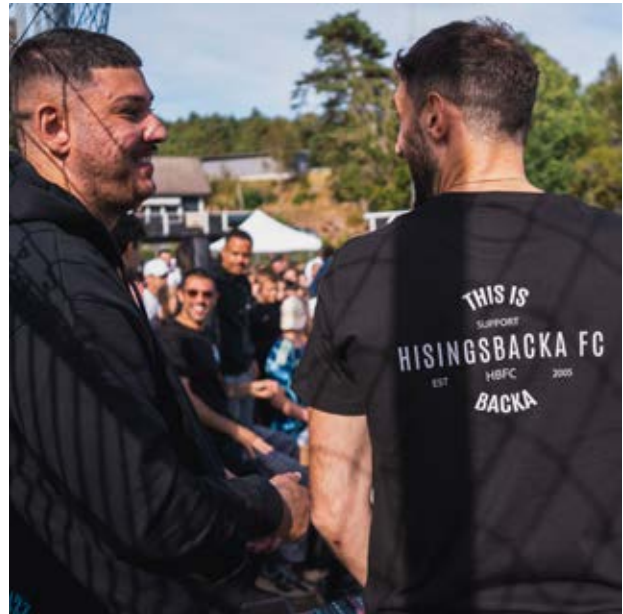
Hisingsbacka FC – En bättre väg

Under 2025 har föreningsutveckling bedrivits i Tynnered, Hisingsbacka och Södra Biskopsgården, med fokus på kontinuitet, tydlig prioritering och lokalt relevanta förflyttningar. Arbetet har kombinerat operativt stöd med strukturerad uppföljning och träffsäker användning av ekonomiskt stöd (när, hur mycket och varför).