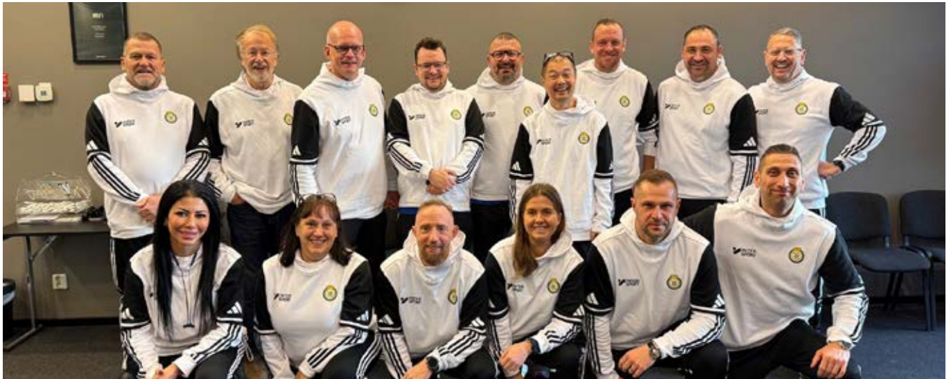
Fortbildning lokala domarutvecklare i Vänersborg i december

En förutsättning för att distriktets tävlingsverksamhet ska få rättvisa förhållanden och att våra ungdomsmatcher ska fylla sin funktion som viktiga utbildningstillfällen, är att distriktets domare håller en hög och jämn kvalitetsnivå. Arbetet med frågor som rör domarna, deras utbildning och arbetsförhållanden har av styrelsen delegerats till en domarkommitté, som haft elva protokollförda möten.